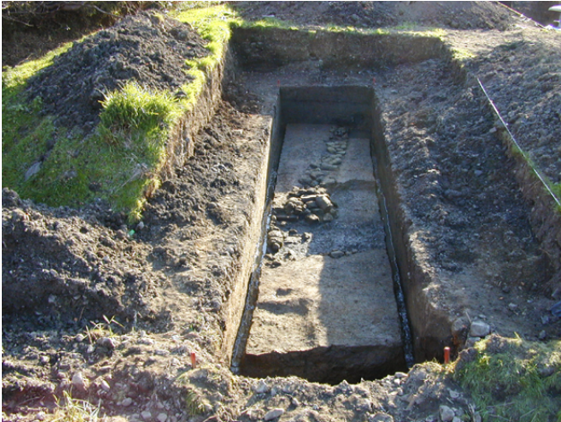
無常院推定地の石列遺構