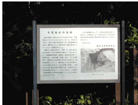
寺尾城址の説明板

に東へ下る溝状の落ち込みがあり、「空堀」と考えられるものです。発掘の結果、この空堀は断面が逆台形をした形で、壁面の傾きが50