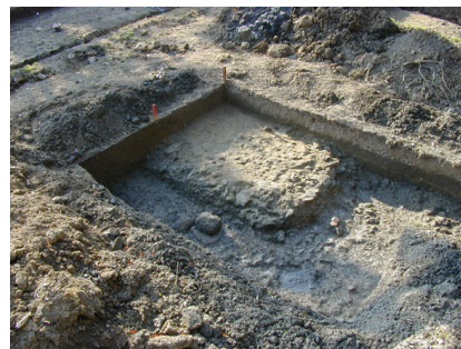
講堂基壇の検出状況