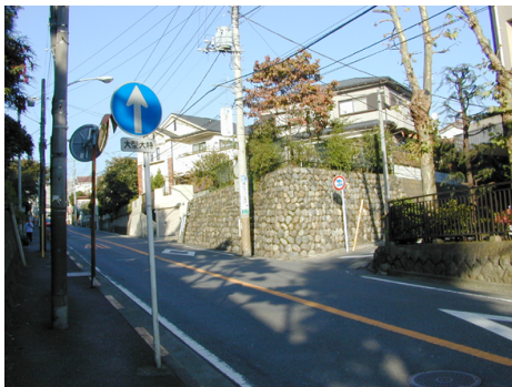
殿山公園への入口

横浜市は緑あふれる環境づくりに関連して殿山公園の樹木の植栽を伴う整備事業を行うことになりました。そこで、平成5年12月に殿山公園の西端を発掘しました。調査面積は約170平方メートルです。調査区域の南端には東西方向