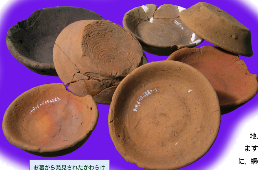
お墓から発見されたかわらけ

古墳時代前期の遺構には、竪穴住居址 1 軒、溝状遺構 6 条、土坑 7 基・炉址 1 基、土器集中出土地点 1 か所などがあります。遺物は土器のほか、網の錘に使われた土錘、鹿や猪などの獣骨や魚骨、削ったあとのある鹿の角、炭化米のかた