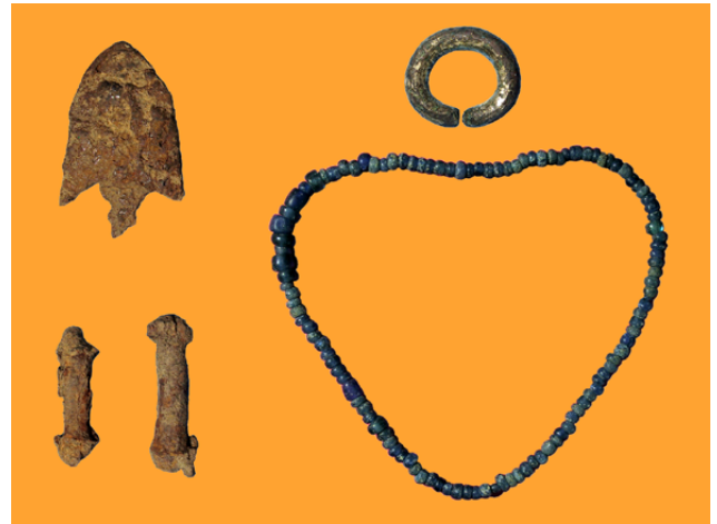
墓から出た品々 鉄鏃・両頭金具・耳飾り・ガラス小玉

副葬品は、装身具（耳飾り・ガラス玉など）、鉄製武器および武器に付属する金具（刀・鏃・両頭金具）、工具（刀子）が発見されました。耳飾りは、銅に金メッキしたものです。鉄製品は、永い年月の間に錆びておぼろげになっており、ほとんどのものが破片となって出土しました。両頭