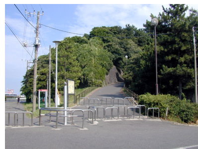
展望台への上り口

発見された遺物は神奈川県立歴史博物館・明治大学・横須賀市立人文博物館などに保管されています。