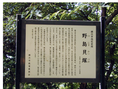
広場の北側にある説明板