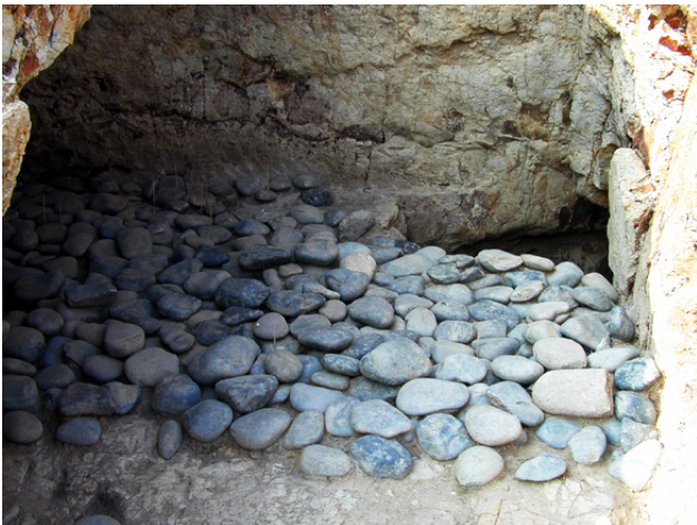
床に敷き詰められた石

床面に敷き詰められる河原石（敷石）も、そのような行為の一つではないでしょうか。石が敷き詰められていた例は、4つで確かめられました。いずれも一部が失われてい