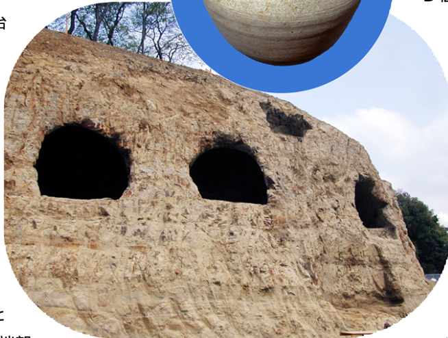
東側の横穴墓群と出土須恵器