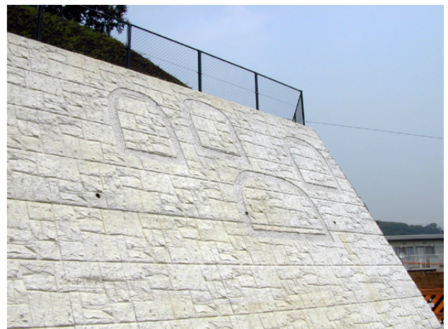
現在の遺跡のようす

現在は、横穴墓内部を見学することはできません。これまでに、横浜市は横穴墓の主なものの位置を壁面に表示す