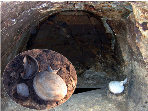
横穴内部のかたちと須恵器出土状態

でした。また、東側に位置する3つは亡きらを安置する玄室の奥壁の一部が残っているだけで、本来のようすがわかりませんでした。比較的残りがよかったものでも、羨道の奥部から玄門付近までしかありませんでした。閉じふさぐ施設も残されておらず、いずれも後の時代に開口した状況を示していました。東側のグループの1つには、宝永4(1707)年に富士山が噴火した時に飛んできた砂のような火山灰(宝永火山灰)が、厚さ10~20cmほど積もっていました。