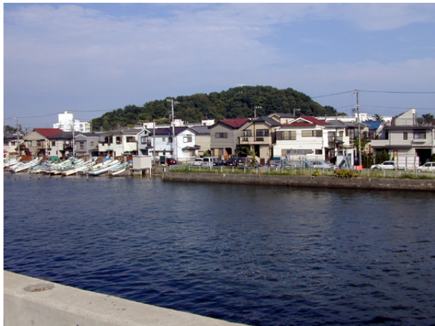
野島橋からみた野島

野島はかつて独立した島でした。この標高53mをはかる山頂部ちかくの縁辺部や斜面に貝塚があることがわかったのは、戦前に砲台を築くために工事が行われて、貝が掘り