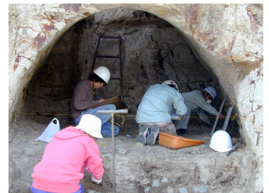
横穴墓調査のようす