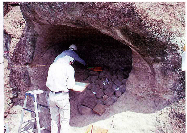
調査中の六浦大道やぐら群 1号やぐら 中に石塔類が放り込まれており、その図面を作成しているところ。

その数は確認されているだけでも金沢区内で300基をゆうに超えており、その分布は中世六浦の景観を考える際の重要な一要素といえるでしょう（次頁図参照）。