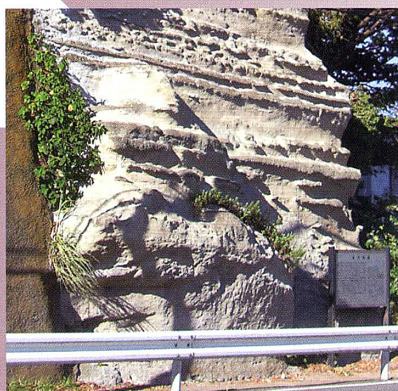
六浦道沿いの鼻欠け地蔵

鎌倉時代からある白山道・六浦道の二つの道の傍らの崖に、今も二つの磨崖仏 しらやま の痕跡をみることができます。これらはいづれの手によって彫られたのかは定かではありませんが、鎌倉時代に遡るといふ説もあります。六浦道沿いの「鼻欠け地蔵 はなか 」と呼ばれる磨崖仏はだいぶ風化が進んでいるものの、今も金沢八景から大船に抜ける環状4号線のすぐ脇にたたずみ、バス通りの往来を見守っています。