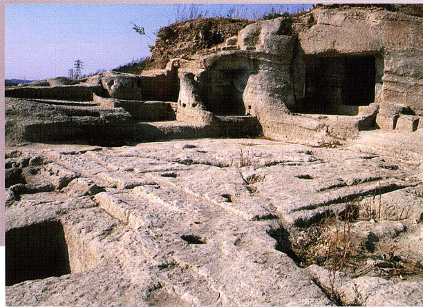
上行寺東やぐら群遺跡（浄願寺推定地） 手前に建物跡、奥にやぐらがある。