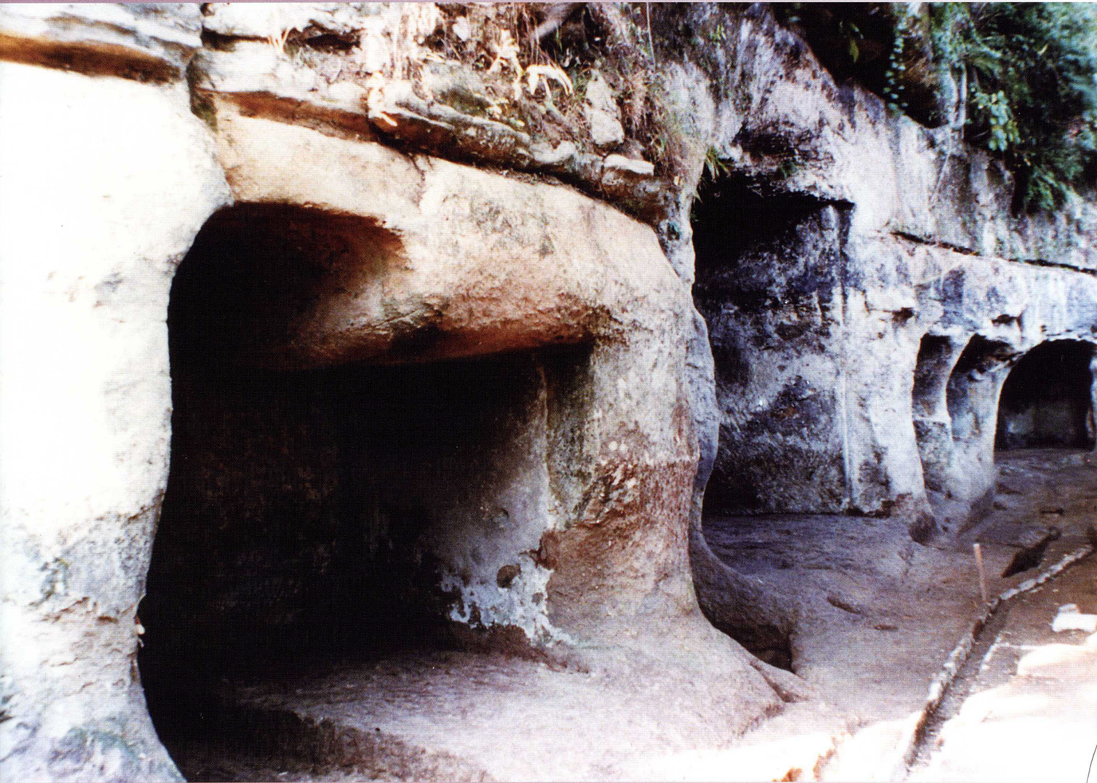
上行寺東やぐら群遺跡（昭和59・61年発掘） 右奥の3基が現在も残されている。