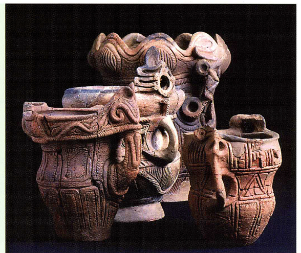
市内出土の優品を展示します!